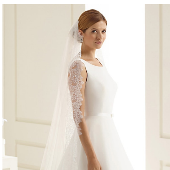
Velo con bordo in pizzo, 200 cm