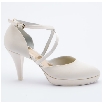
Scarpa sposa con listini incrociati