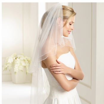
Velo con bordo ondulato, 110/70